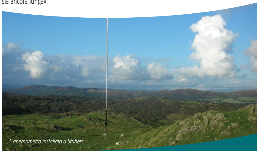
L'anemometro installato a Stribers