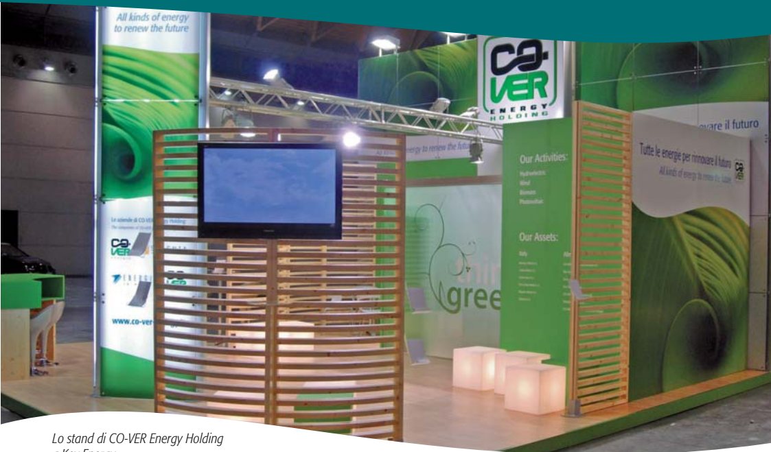
Lo stand di CO-VER Energy Holding a Key Energy