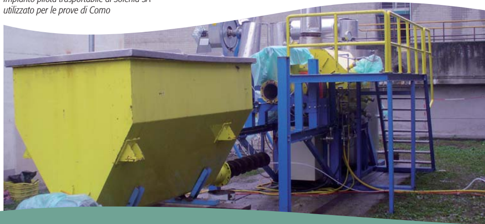
Impianto pilota trasportabile di Solenia SA utilizzato per le prove di Como

Al momento Solenia SA sta redigendo tutta la documentazione di progetto necessaria ad avviare l'iter autorizzativo.