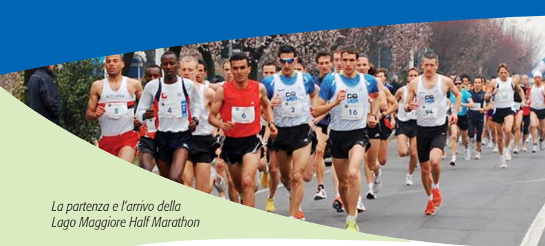
La partenza e l'arrivo della Lago Maggiore Half Marathon